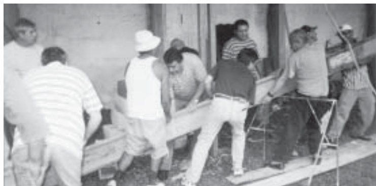
Com a força de todos a viga de aço, com mais de 12 metros, foi colocada em seu devido lugar para sustentar o telhado do salão de festas

O projeto previa na verdade duas obras: a primeira reforma, do casarão para abrigar o Templo e dependências como a secretária, espaço para nossa sala de aula e arquivo; a segunda nosso salão de festas. Para executar essas duas obras foi preciso muita competência