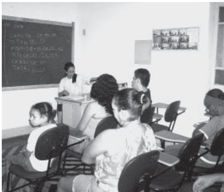
Dez alunos participam da terceira turma, em fase de conclusão, do Curso de Alfabetização de Jovens e Adultos da Loja Lealdade e Civismo

Com a conclusão de mais um Curso estaremos formando a terceira turma que atualmente conta com 10 alunos inscritos, a maioria de moradores vizinhos da Loja, sendo 100% deles oriundos da Região Nordeste.