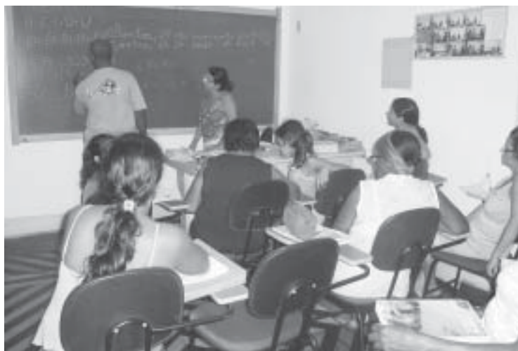
Objetivos: continuidade dos estudos e valorização da cidadania

É visando o resgate e a valorização da cidadania de alguns cidadãos que a Loja Maçônica Lealdade e Civismo promove,