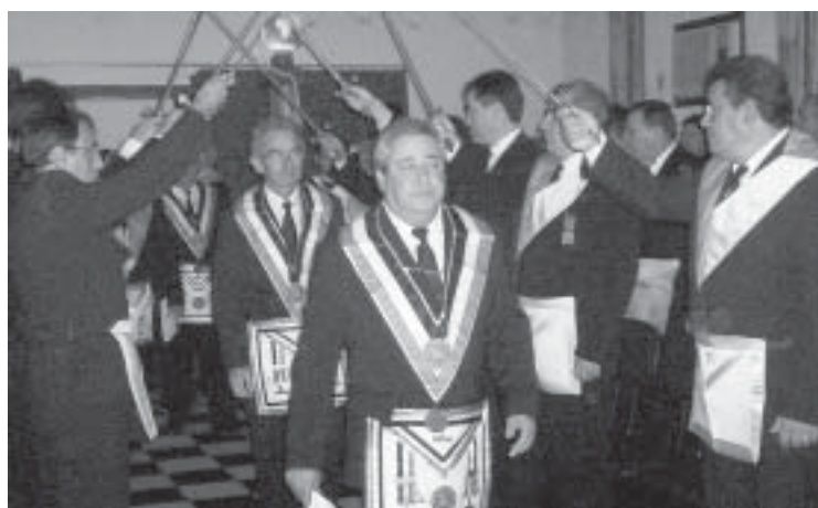
Cortejo de entrada da Comissão Instaladora