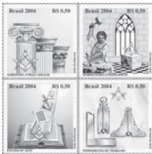
Selos postais comemorativos do Dia do Maçom